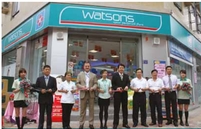
台灣屈臣氏於六月至九月期間增設了九家新店，目標是於二〇一〇年十二月前共開設二十家新店。