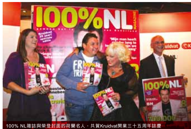
100% NL雜誌與榮登封面的荷蘭名人，共賀Kruidvat開業三十五周年誌慶