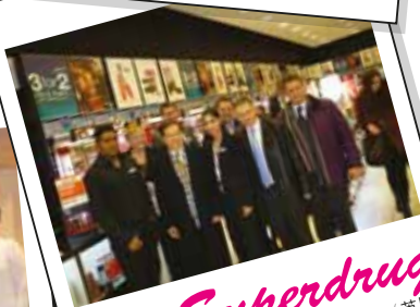
Superdrug Westfields Shopping Centre (英國)