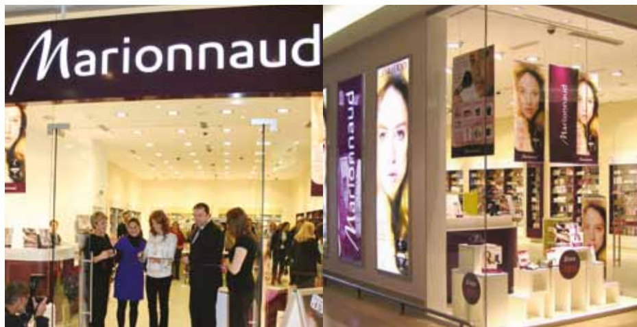
Marionnaud位於斯洛伐克首都布拉迪斯拉發的Polus分店於十月七日重開，成為Marionnaud在當地的首間新概念店，並邀得著名女星擔任嘉賓出席並試用Marionnaud全新的Skin Care Line Beauty Essential，成為全場焦點。