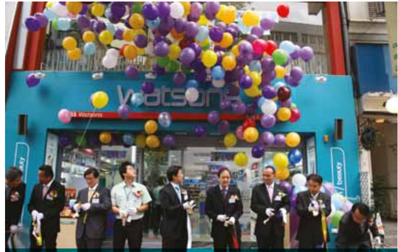
韓國屈臣氏第三十家分店於七月在Jongro區隆重開幕。至九月中旬，當地的屈臣氏店舖已增至三十三家。