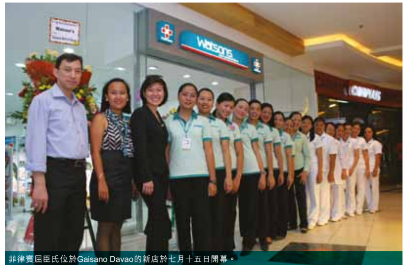
菲律賓屈臣氏位於Gaisano Davao的新店於七月十五日開幕。