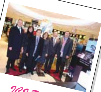
101 PARIS XL Wijnegem Shopping Centre (比利時)