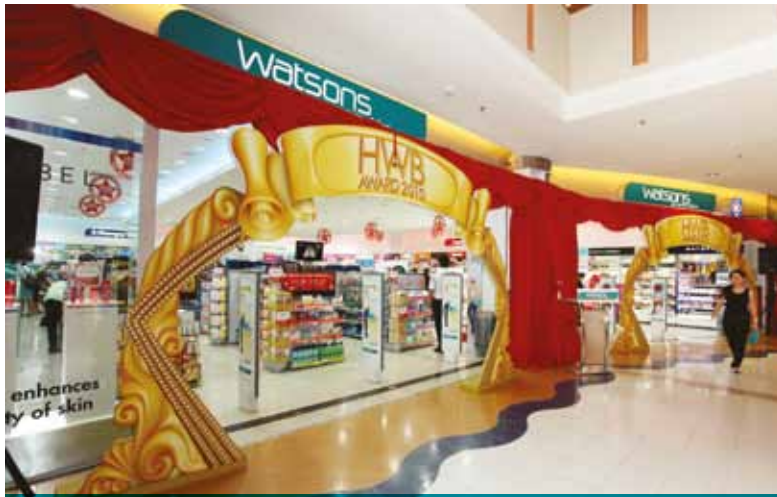
馬來西亞屈臣氏的Sunway Pyramid分店重開。店舖採用最新的第五代概念設計。