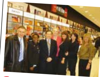
The Perfume Shop in Superdrug Westfields Shopping Centre (英國)