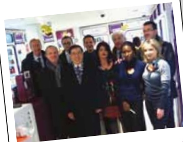
Marionnaud Levi (法國)