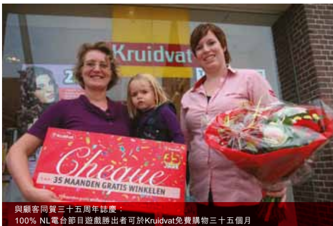
與顧客同賀三十五周年誌慶： 100% NL 電台節目遊戲勝出者可於Kruidvat免費購物三十五個月