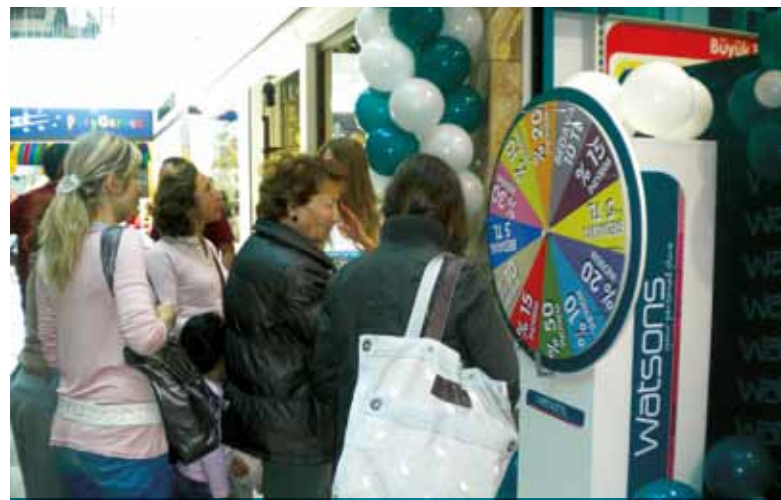
土耳其屈臣氏為慶祝於三個城市共開設六家新店，特別放置了幸運輪，刺激銷售外更為新店帶來人流。