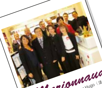
Marionnaud Victor Hugo (法國)