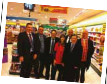
Kruidvat Wijnegem Shopping Centre (比利時)