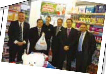
Savers North End Road, Fulham (英國)