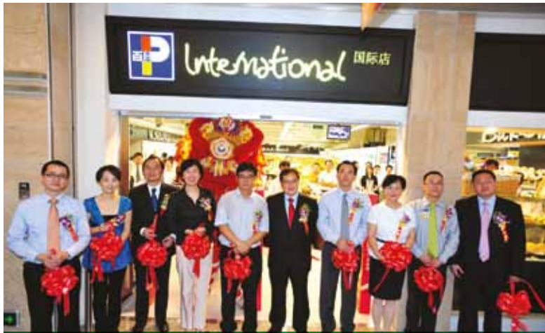
廣州首家百佳國際店於八月十日開幕，提供超過八千種優質食品及其他產品，滿足市民不斷提高的生活品味。