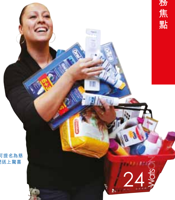
「一分鐘免費購物為慈善」— 顧客可提名為慈善團體擔任義工的親友參加，為他們送上驚喜