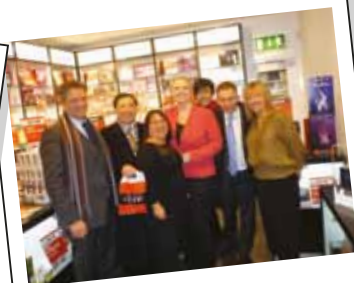
The Perfume Shop Victoria Street (英國)