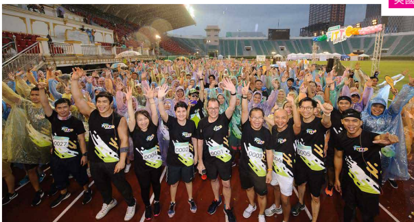
泰國屈臣氏－二〇一七健康步行日