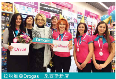
拉脫維亞Drogerie – 采西斯新店