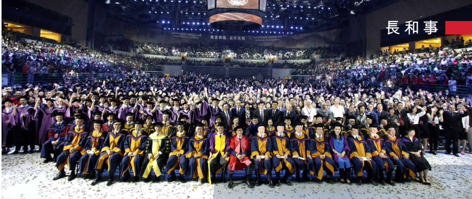
李嘉誠先生與一眾嘉賓、校董、老師及同學們在汕大畢業典禮上大合照

李先生在致辭時表示，在高增長機遇巨浪中，愚人見石，智者見泉。愚人常常抱怨被逼墨守成規、被制度營役、被繁文縟節網綁、被不可承受的期望壓到透不過氣；他們渴望「贏在起跑線上」，希望有個富爸加上天賦的優越組合，認為改變塵世複雜和無可奈何的扭曲太負重，「道能弘人」肯定更舒服。