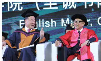
諾貝爾文學獎得主莫言教授豎起拇指，向李嘉誠先生盛讚汕大畢業典禮是讓他最激動的畢業典禮