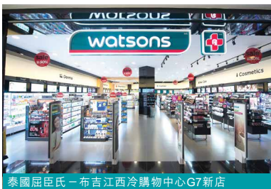
泰國屈臣氏 – 布吉江西冷購物中心G7新店