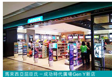
馬來西亞屈臣氏 – 成功時代廣場Gen Y新店