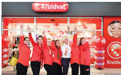
Kruidvat – 於比利時及荷蘭開設六間新店