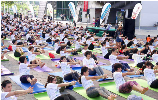
新加坡屈臣氏 - 瑜珈活動