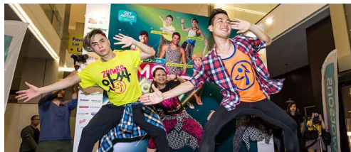
馬來西亞屈臣氏 - 舞動森巴揭幕活動