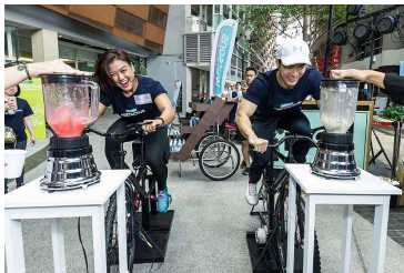
馬來西亞屈臣氏－活出健康活動