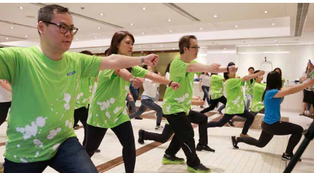
香港屈臣氏－活出健康活動