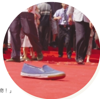
「即使掉下鞋子，我也要百佳購物！」

位於惠州惠城區家華花園的百佳購物廣場在六月正式投入服務。該分店樓高三層、佔地一萬五千多平方米，提供超過二萬種商品，更同時設有休閒吧、美容廳、藥房及眼鏡店等，充分體現「一站式」的優質購物環境及「價格抵、貨品全、品質高、服務優」的經營理念。