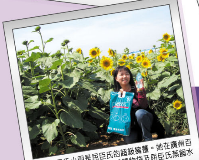
廣州屈臣氏小明是屈臣氏的超級擁護。她在廣州百萬葵園前，亦不忘以屈臣氏購物袋及屈臣氏蒸餾水作伴。