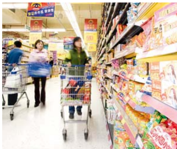
百佳的「省錢精明眼」保證，為南中國地區的顧客提供價格實惠的貨品。

中國百佳洞察零售市場變化，不斷進行市場調查，了解消費者的需要。百佳開設購物廣場、超級廣場和超級市場三種店鋪模式，為顧客提供「一站式」的購物便利與樂趣；而店鋪設計亦緊貼潮流，力求清新、簡潔、明快，滿足顧客的視覺要求，令購物時倍加輕鬆舒適。百佳的店內設計，更連續兩年獲廣東省連鎖經營協會頒予「最佳賣場設計」獎。