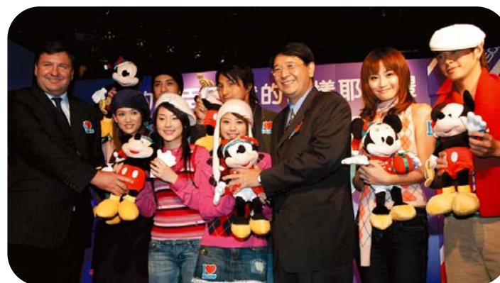
台灣屈臣氏邀請人氣偶像「喬傑立家族七朵花」及「183Club」擔任聖誕愛心大使。