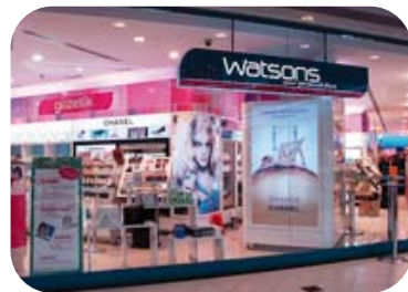
土耳其最大的屈臣氏剛於伊斯坦堡的 Cevahir 購物中心開幕。