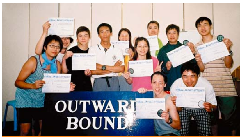
SDG2 團隊在二〇〇五年六月成功完成戶外體驗課程。

這項計劃不僅對同事有莫大裨益，亦有助公司訂立長遠的人才培訓方針。為加強此計劃的成效，管理層每月均向有關店舖經理了解參與學員的工作表現及同事的反映、而店舖業務部業務董事和人力資源經理亦會進行檢討及分析，從分店的營業額及整體表現來評估學員的管理能力，從而改善學員的表現及提升培訓計劃的效益。