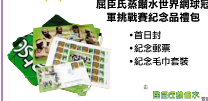
屈臣氏蒸餾水世界網球冠軍挑戰賽紀念品禮品