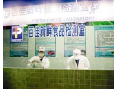
百佳的新鮮食品及優質產品屢獲稱譽。