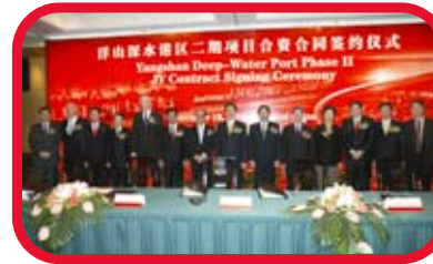
洋山深水港區二期項目合資合同簽約儀式。和記黃埔有限公司主席李嘉誠（左七）及上海市市長韓正（左八）。