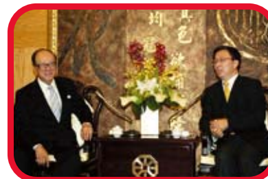
洋山深水港區二期項目合資合同簽約議程之一，上海市市長韓正與和記黃埔有限公司主席李嘉誠（左）會面。