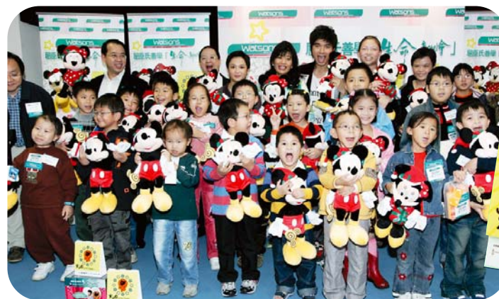
古巨基帶同聖誕米奇與美妮到瑪麗醫院探訪一班血友病患者及已接受骨髓移植的病人，為他們送上歡樂。

同時，百佳更與環境保護署簽訂「減發膠袋目標協議」承諾。於未來一年減少四千萬個膠袋。 PARK'SHOP