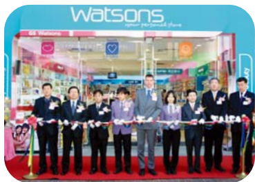
韓國屈臣氏於一月六日在 Gangnam 區開設第四家分店。