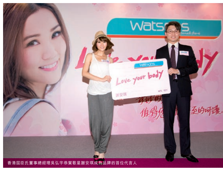
香港屈臣氏董事總經理吳弘宇恭賀歌星謝安琪成為品牌的首位代言人