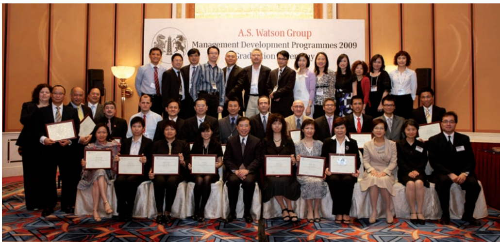
五月，屈臣氏集團董事總經理黎啟明分別與亞洲高級管理發展課程和亞洲管理發展課程（上）以及中國商務管理課程（下）的畢業生合照